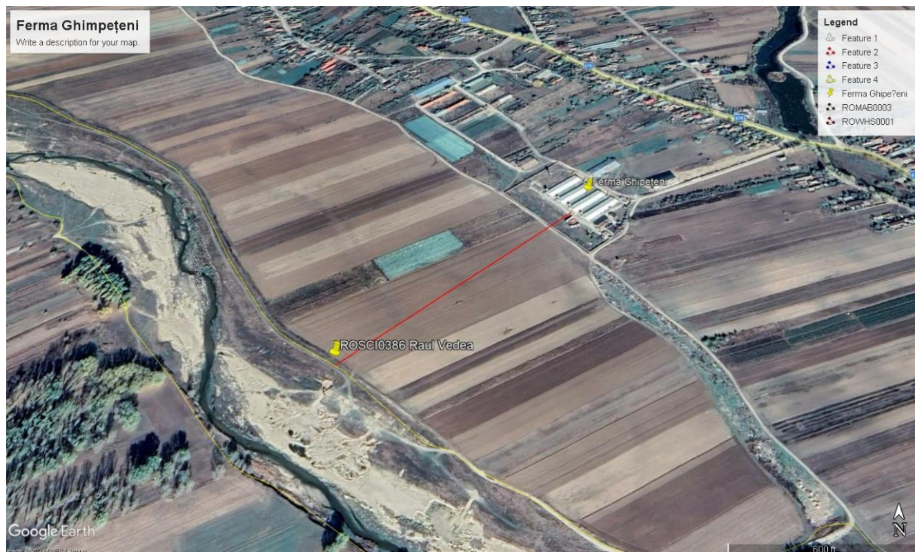
Localizare Fermă în raport cu limita ROSCI0386 Raul Vedeia

În proximitatea amplasamentului fermei nu au fost identificate habitate criteriu de interes conservativ sau populații de specii pentru care a fost desemnat situl ROSCI0386.