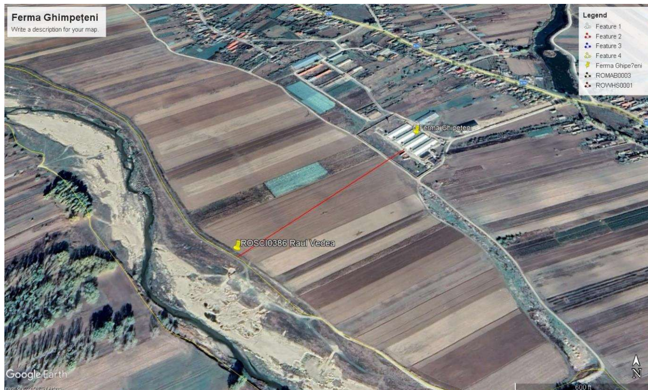
Localizare Fermă în raport cu limita ROSCI0386 Raul Vedea

În proximitatea amplasamentului fermei nu au fost identificate habitate criteriu de interes conservativ sau populații de specii pentru care a fost desemnat situl ROSCI0386.