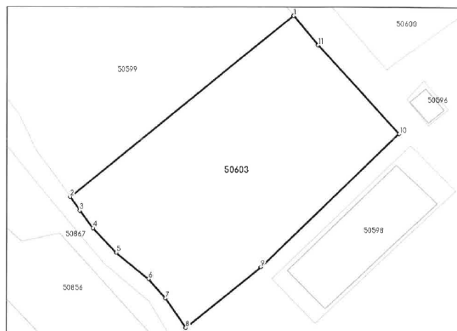
Figura 2 – Plan de situatie