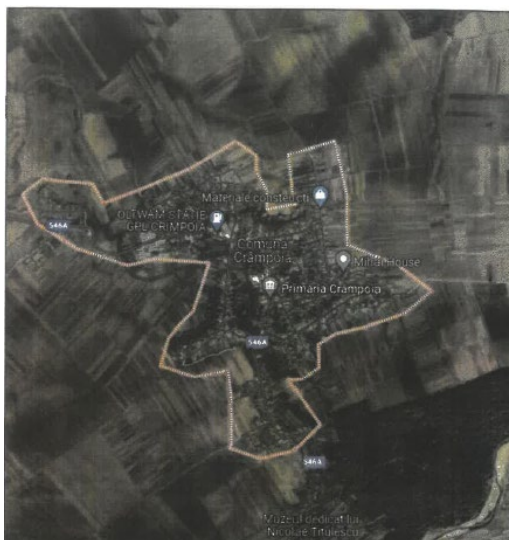
Figura 1 – Plan de incadrare in zona