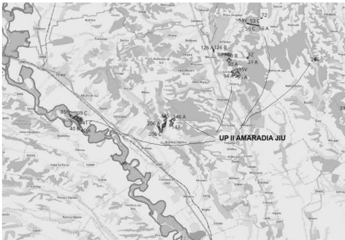
Foto.1 –Relatia fondului forestier cu siturile de importanta comunitara